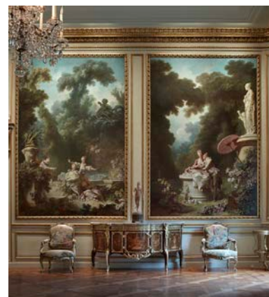
Le Salon aux Fragonard, La Frick Collection, New York

L'acquisition de peintures préoccupa Henry Clay Frick bien avant son emménagement à New York dans les premières années du XX e siècle. Alors qu'il louait l'hôtel particulier de William H. Vanderbilt au coin de la 5 e avenue et de la 51 e rue, il acheta de nombreux chefs-d'œuvre de Rembrandt, de Vélasquez et d'autres maîtres anciens. Mais, c'est pendant la construction de sa somptueuse demeure sur la 70 e rue, entre 1912 et 1914, qu'il prit conscience de la nécessité d'acquérir des meubles anciens et objets d'art de qualité équivalente à sa collection de tableaux. Il effectua ainsi en très peu de temps la plupart de ses achats dans ce domaine juste avant, ou juste après, son emménagement dans cette demeure.