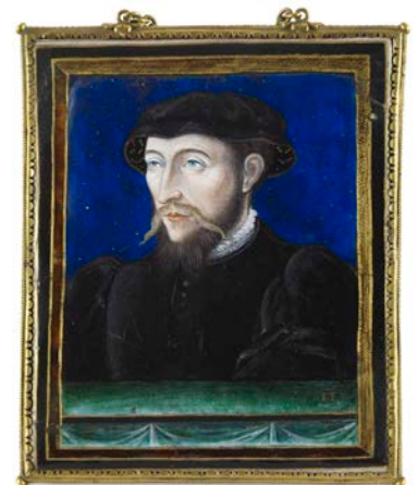
Léonard Limousin (c. 1505–1575/77), Portrait d'homme (Antoine de Bourbon?) , ca. 1560, Limoges, Émail peint sur cuivre, partiellement doré, La Frick Collection, New York

Frick élargit rapidement sa collection grâce à l'acquisition en bloc d'objets d'art décoratif, tels que les quarante-huit émaux de Limoges provenant de la succession de J. Pierpont Morgan, qu'il acheta par l'intermédiaire de Duveen. Le décès de Morgan en 1913 fournit à Frick l'occasion de choisir des pièces parmi l'une des plus belles et des plus importantes collections du monde, au moment où il cherchait à développer la sienne. L'acquisition