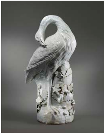
Outarde barbue , modelée par Johann Gottlieb Kirchner, manufacture de porcelaine de Meissen, Allemagne, 1732, Porcelaine dure, La Frick Collection, New York; photo: Maggie Nimkin

La collection d'arts décoratifs de la Frick Collection continue de s'enrichir grâce aux dons généreux de membres de la famille Frick et d'autres donateurs. En 1965, le fils du fondateur, Childs Frick, donna plus de deux cents porcelaines de Chine au décor bleu et blanc, augmentant considérablement le nombre de pièces que son père avait achetées cinquante ans plus tôt. En 1999, Winthrop Kellogg Edey légua au musée sa collection extraordinaire de quelque quarante horloges, pendules et montres. Henry Arnhold a récemment donné une pièce importante, l' Outarde barbue , promettant en sus cent trente-cinq porcelaines de Meissen. Des acquisitions d'un seul objet de grande valeur viennent également enrichir nos trésors. Par exemple, Diane Modestini fit don