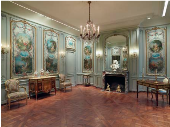
Le Salon aux Boucher, La Frick Collection, New York