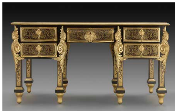
André-Charles Boulle et Etienne Levasseur, France, Paris, ca. 1692-95 et ca.1770 (avant 1777), Chêne, sapin et noyer, marqueterie de laiton et d'écaïlle de tortue, ébène ; bronze doré, cuir, La Frick Collection, New York

Le voyage que Frick fit à Londres et à Paris au printemps 1914 lui inspira un grand nombre des choix qu'il fit pour son hôtel particulier de New York. Après avoir rencontré Victor Cavendish, neuvième duc de Devonshire, à Lansdowne House (Londres) et dans son château de Chatsworth, Frick lui acheta des sièges garnis de tapisseries tissées aux Gobelins au XVIII e siècle.