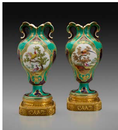
Deux vases « à oreilles » manufacture de porcelaine de Sèvres, ca. 1759. Porcelaine tendre et bronze doré, La Frick Collection, New York; photo: Michael Bodycomb

Le voyage que Frick fit à Londres et à Paris au printemps 1914 lui inspira un grand nombre des choix qu'il fit pour son hôtel particulier de New York. Après avoir rencontré Victor Cavendish, neuvième duc de Devonshire, à Lansdowne House (Londres) et dans son château de Chatsworth, Frick lui acheta des sièges garnis de tapisseries tissées aux Gobelins au XVIII e siècle.